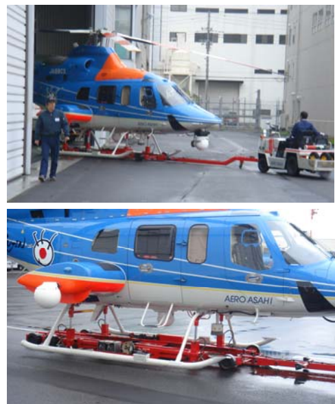
写真-1 ヘリのトーイング状況