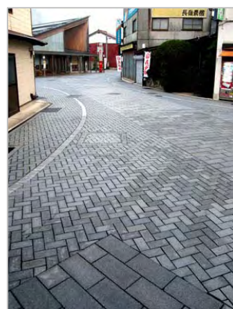
写真-2 切石舗装例/津和野 (2009 土木学会デザイン賞受賞)