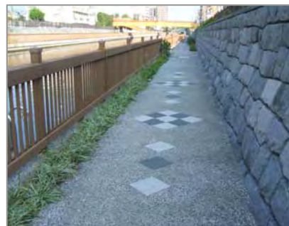
写真-1 洗い出し舗装例

これは既往施工の上流側園路と調和すると共に、曲線的な園路へと移行させ、緑の中を散策するような自然と調和する園路として計画しました。また江戸時代に発展した美術工芸の模様を取り入れ、江戸らしさを演出するため鉄平石乱張の中にサイズの異なる切石をアクセントとして配置し、和の趣が感じられる石畳として、江戸の風情が感じられる形としています。なお大部分の園路は洗い出し舗装を行う計画です。