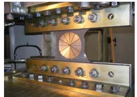
写真-1 LENS型せん断パネルダンパー