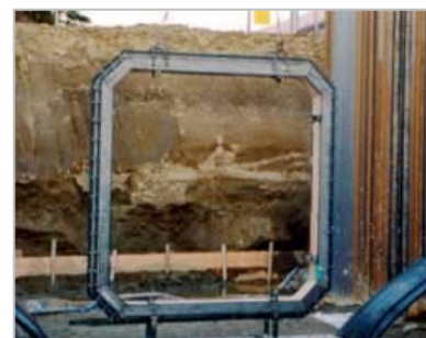
写真-3 可とう継手例 (イメージ)