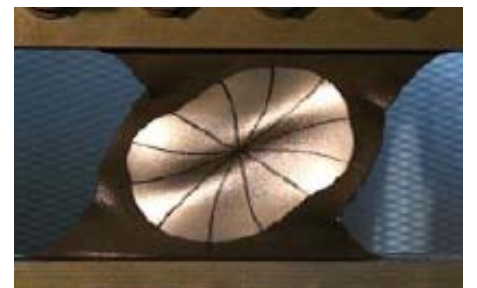
写真-2 せん断パネルの実験状況例