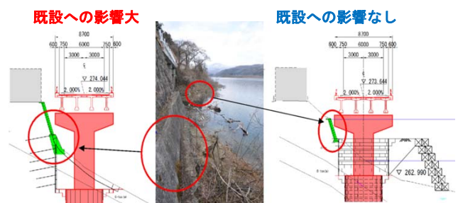
図-2 既設構造物へ影響低減仮設工法